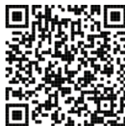
台灣萬國兒童佈道團