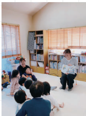
奈良日本教會兒童閱讀會