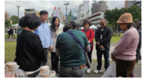
與文山區眾教會一起禱告

2025年11月18日一通電話打開了我們停擺已久的台北事工之門，原來在台北文山區有一對愛主的肢體，願意無償提供一層2樓辦公室給我們使用。神成就了一件超過我們所求所想的事。我們存著敬畏的心領受，並知道是神在我們心裡運行，為要成就祂的旨意。