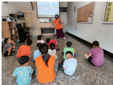
台中區水湳聖教會的喜樂園

萬國兒童佈道團，可以協助教會建立活潑的兒童事工；透過完備的福音師資訓練，提供各種福音性的教材與教具，協助老師教導一個充滿救恩信息並幫助兒童靈性成長的課程。