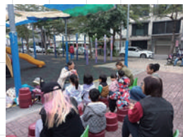
台南在西湖公園 的喜樂園