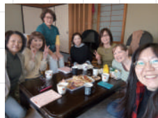
仙台事工中心英文café