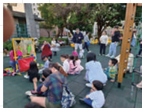
台中區 在中山公園演的 聖誕黑光劇