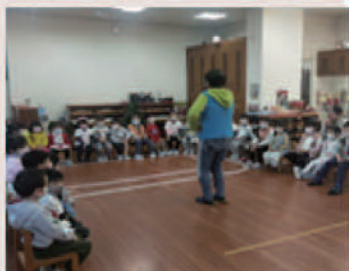
■ 台南幼兒園 CPC ■