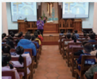
■ 金門教會CPC ■