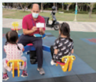
■ 澎湖戶外佈道 ■