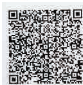
台灣萬國兒童佈道團